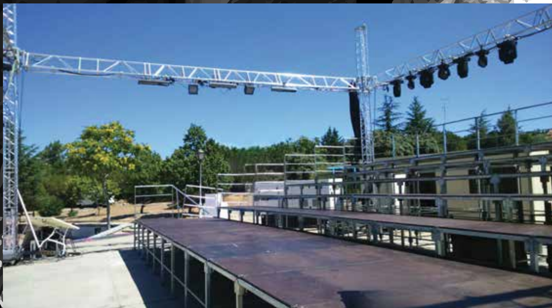
FOTO: Ejemplo real de grada para coro

Nuestra organización pondrá a disposición del evento al menos dos regidores que serán los encargados de comunicarse y coordinar toda la actuación con los técnicos de sonido e iluminación y un técnico de sonido titulado de apoyo. El equipo de sonido e iluminación necesario para la celebración del concierto deberá ser contratado directamente por el Promotor, y deberá tener la suficiente potencia y calidad para el lugar y aforo previsto, según rider técnico que se proporcionará por Rock Choir.