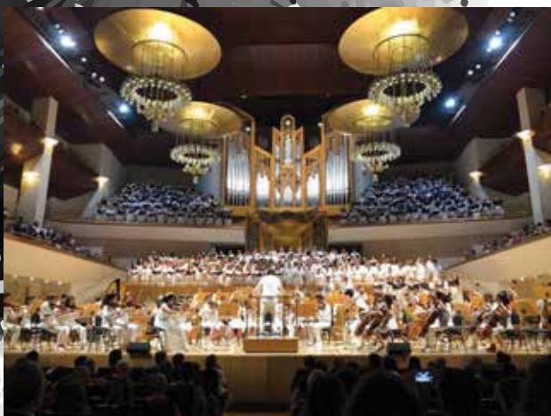
FOTO: Actuación Auditorio Nacional

El coro está acompañado de varios músicos profesionales, en un número que varía entre seis y diez, en función del concierto a exhibir. Todos los músicos tienen amplia experiencia en actuaciones en directo, lo que facilita las pruebas de sonido y garantiza el éxito del concierto.